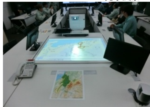
電子黒板システム